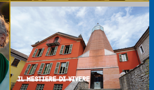
IL MESTIERE DI VIVERE