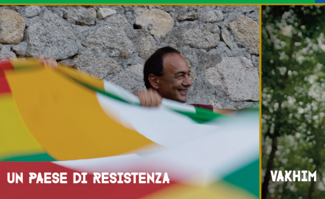
UN PAESE DI RESISTENZA