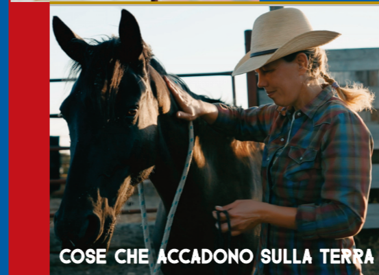
COSE CHE ACCADONO SULLA TERRA