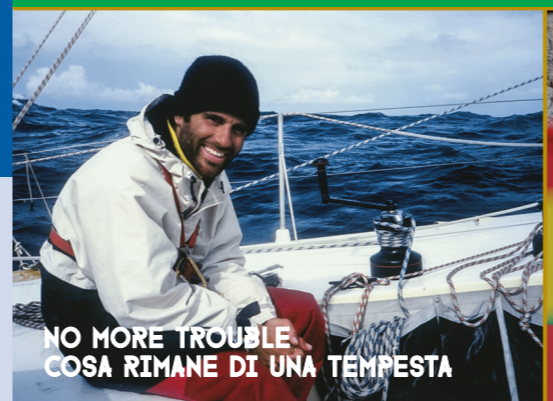
NO MORE TROUBLE COSA RIMANE DI UNA TEMPESTA