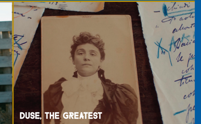
DUSE, THE GREATEST