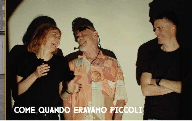
COME QUANDO ERAVAMO PICCOLI