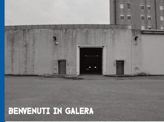
BENVENUTI IN GALERA