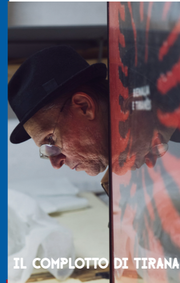
IL COMLOTTO DI TIRANA